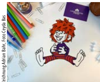
Zeichnung Adrian Bahr, Foto Ceyda Bas